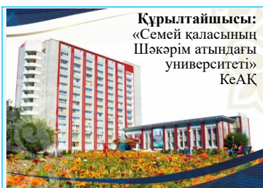
Құрылтайшысы: «Семей қаласының Шәкәрім атындағы университеті» КеАҚ

Қазақстан Республикасының Ақпарат және коммуникациялар министрлігінің Ақпарат комитеті берген тіркеу куәлігі № 17310-Г 13 қазан 2018 жыл.